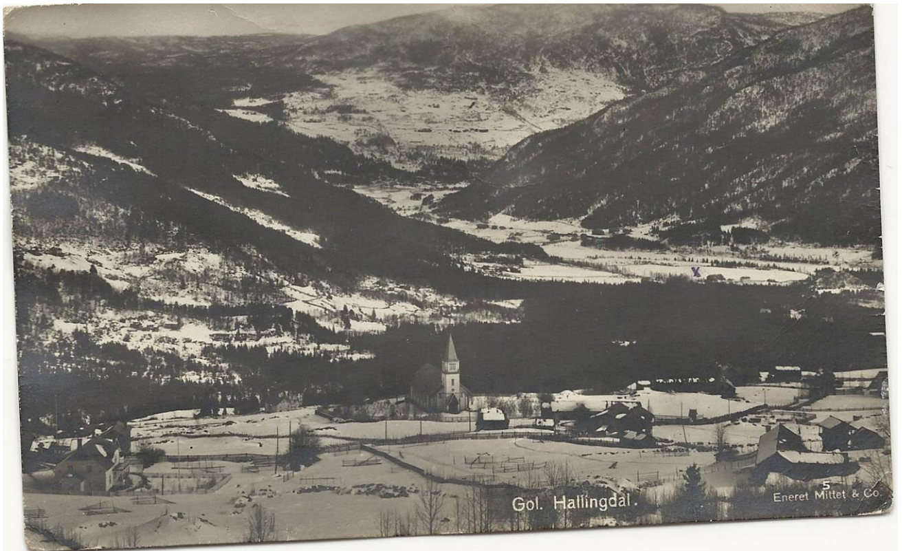
Gol mot Herad mest sannsynleg rundt 1910.