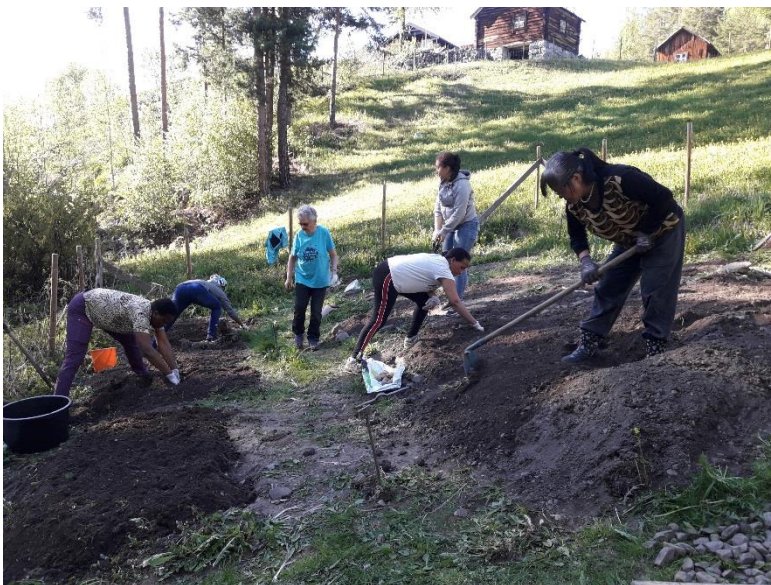
Torsdagstreffet sin kjøkkenhage på Renslotunet