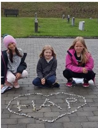
Tårnagentar har laga «håpshjarta» i koronatider

Tårnagenthelga i juni vart ein digital-/heimeversjon. Det vart spelt inn ein film i Gol og Herad kyrkja i forkant som vart sendt til deltakarane før helga. Denne såg deltakarane heime før dei vart sendt ut på oppdrag i lokalmiljøet og på kyrkjegarden i Herad. Filmen inneheldt ein del hint om kvar i Herad dei kunne finne ei agentgåve (Tårnagentbuff og tårnagentavis). På kyrkjegarden i Herad utførde dei i tillegg oppdrag symboljakt. 8 agentar frå 3.klasse deltok.