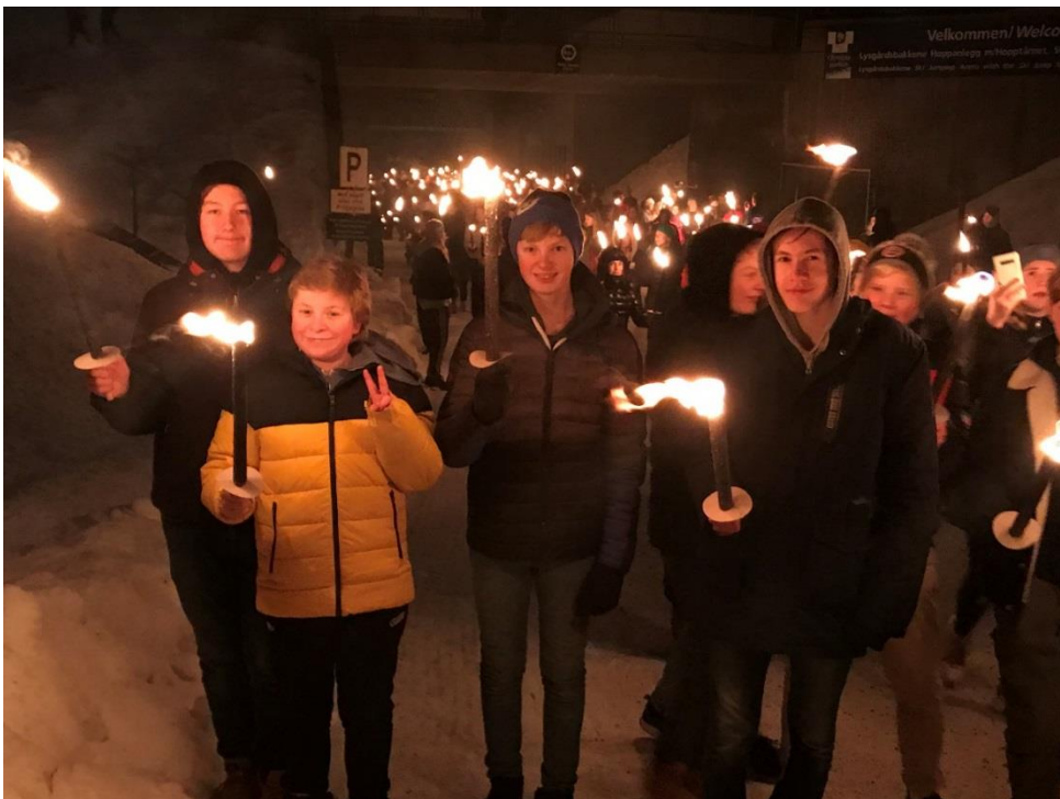
Konfirmantar i fakkeltog på Hekta- leiren